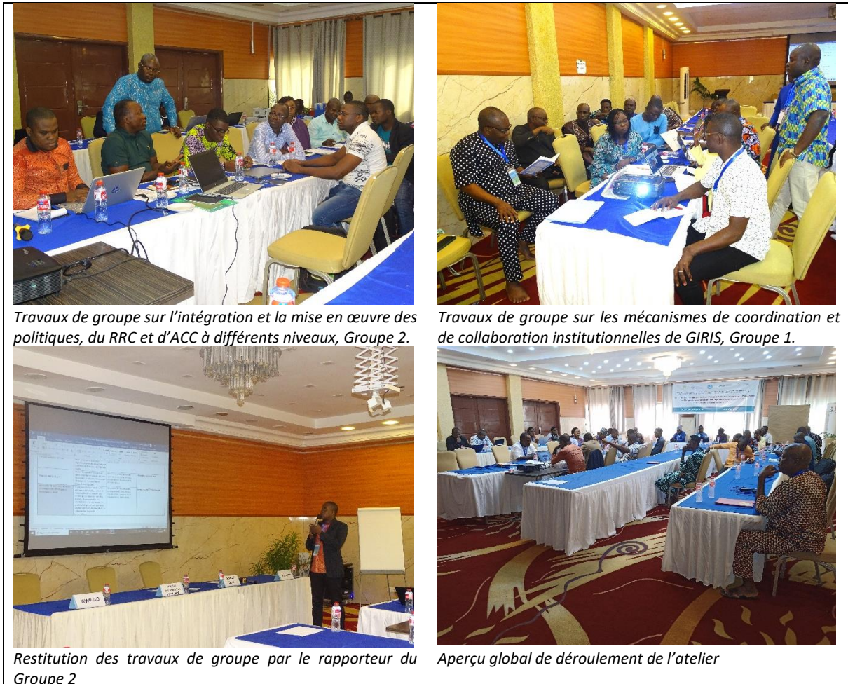
Travaux de groupe sur l'intégration et la mise en œuvre des politiques, du RRC et d'ACC à différents niveaux, Groupe 2.

Au nombre des techniques d'animation de l'atelier figurent entre autres le brainstorming, le partage des expériences des participant(e)s, les intermèdes d'animation pour casser la monotonie et retenir l'attention des participants, les exposés/débats, les travaux de groupe et la restitution en plénière. Pour chaque travail de groupe, les participant(e)s ont reçu la documentation numérique et /ou en version papier. L'atelier national s'est déroulé en français puisqu'il a réuni des agents techniques instruits ainsi que les élus locaux du bassin de la Volta au Bénin. Les photos ci-dessous montrent l'ambiance de déroulement de l'atelier.